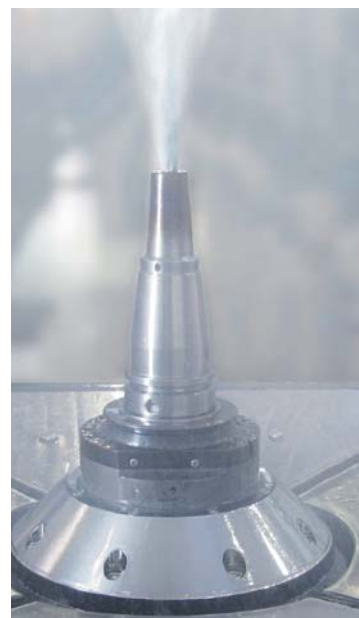
L'illustrazione mostra: Raffreddamento ottimizzato fino al tagliente legato alla pressione e velocità. Parte sporgente: 28 mm, Utensile \varnothing 4 mm