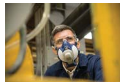
Motorino S204950010 montato sulla semimaschera