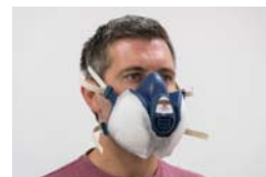
Prefiltro S204950005 montato sulla semimaschera