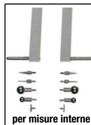
per misure interne